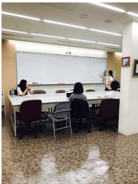
講師以圖形及文字統整內容