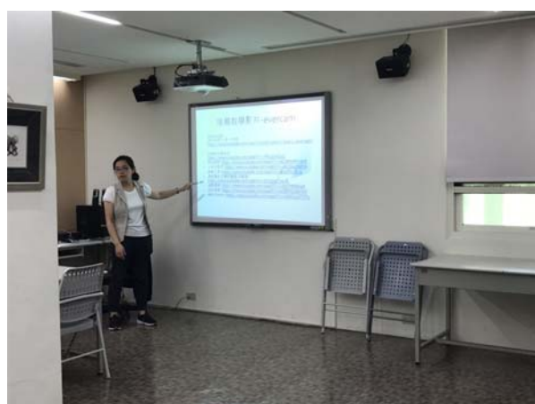
講師以簡報方式呈現內容